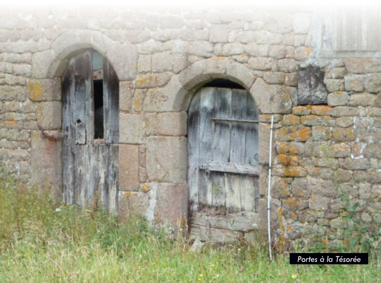
Portes à la Trésorée

Ce qui, hormis l'histoire, sur ce sentier est remarquable, c'est la présence d'arbres d'essences diverses, la variété des paysages végétaux et des points de vue, notamment sur le versant nord de la Rouvre. Ouvrez l'œil, ils vous raviront.