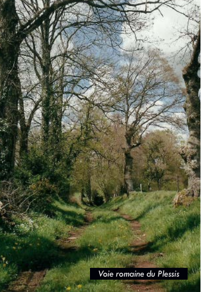
Voie romaine du Plessis

Ce circuit montre une campagne pleine de surprises paysagères et de témoins d'une histoire très ancienne. Il suit et croise à plusieurs reprises la rivière de la Gine, petit ruisseau vif argent qui fût en son temps le lieu d'installation de moulins et d'industries artisanales liées notamment au tissage et à la teinture.